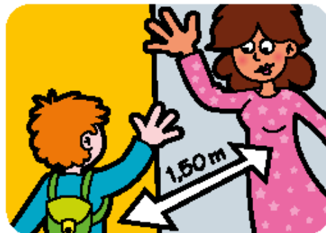
1,5 meter afstand van juf of meester