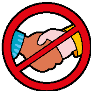
Geen handen schudden