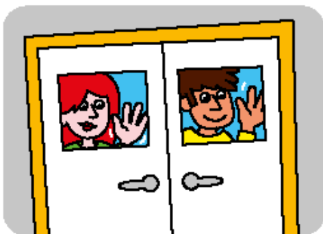
Ouders blijven buiten