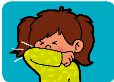
Hoesten en niezen in de elleboog